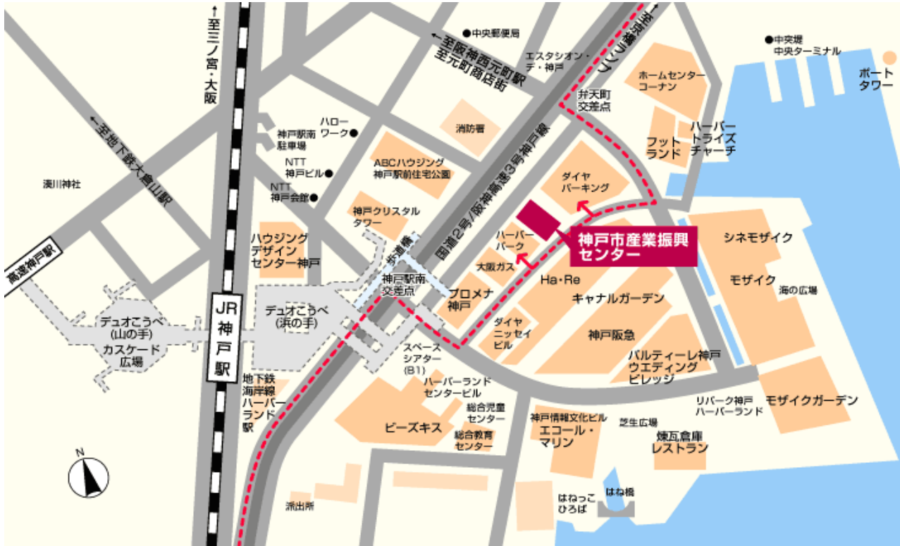
神戸駅前地下街(デュオこうべ)拡大図

住所:神戸市中央区東川崎町1丁目8番4号(神戸ハーバーランド内) 電話:078-360-3200