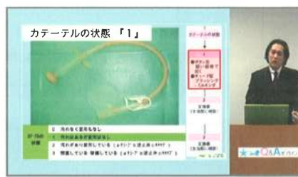
講師:滋賀PEGケアネットワーク世話人 西山医院院長 西山順博先生